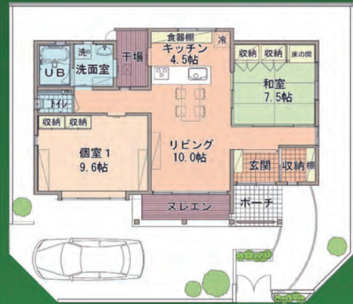
※その他、敷地の条件によっては間取りの変更は可能です。