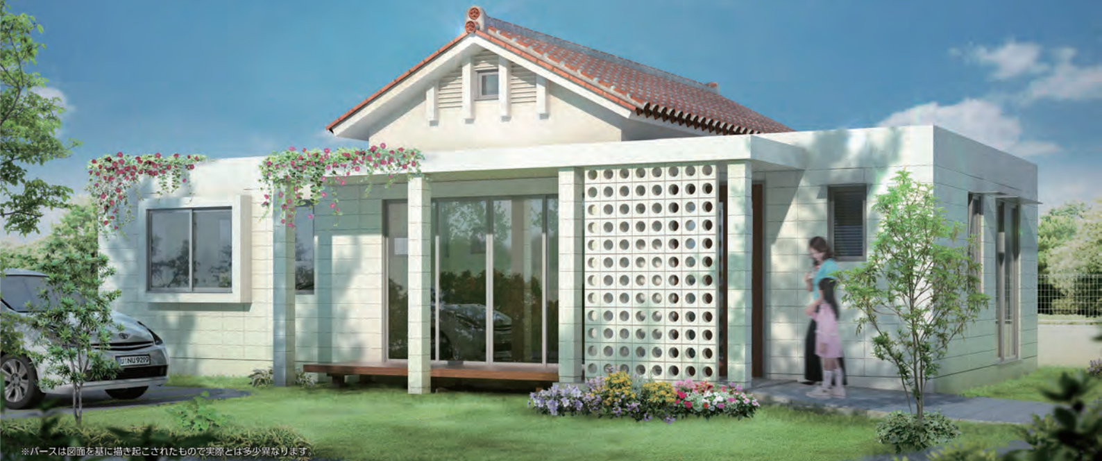
※パースは図面を基に描き起こされたもので実際とは多少異なります。

「しびらんかハウス」は、 コンクリートブロック 壁体に木造赤瓦屋根を のせたハイブリッド構 造です。 より沖縄らしい涼しさ を追求した県内初の混 構造企画住宅。