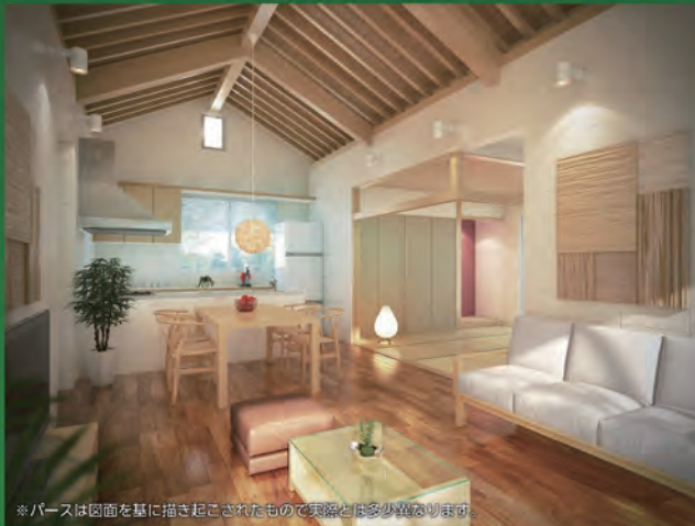
※パースは図面を基に描き起こされたもので実際とは多少異なります。

「しびらんかハウス」は、 コンクリートブロック 壁体に木造赤瓦屋根を のせたハイブリッド構 造です。 より沖縄らしい涼しさ を追求した県内初の混 構造企画住宅。